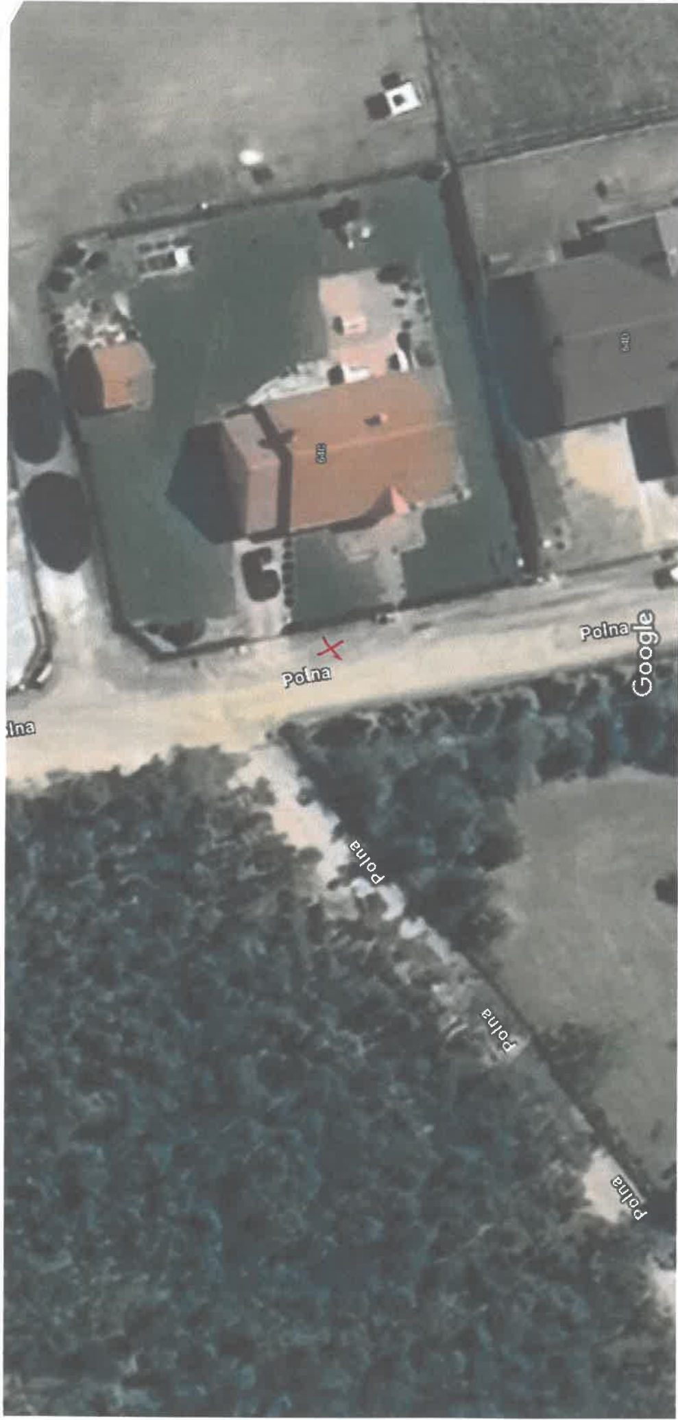
Zdjęcia ©2024 Airbus,Maxar Technologies,Dane mapy ©2024 Google 10 m